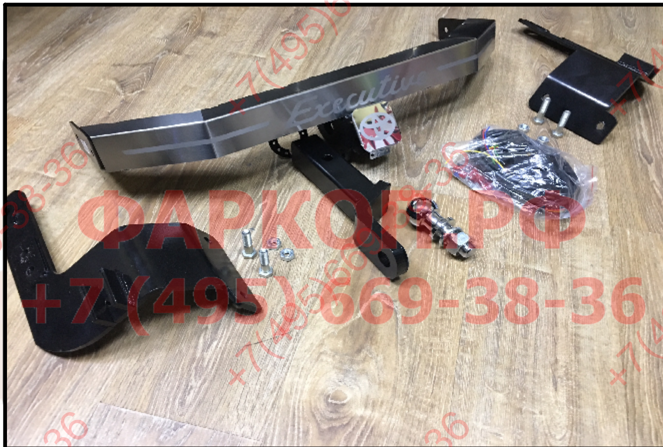
Фаркоп арт. TCU00045