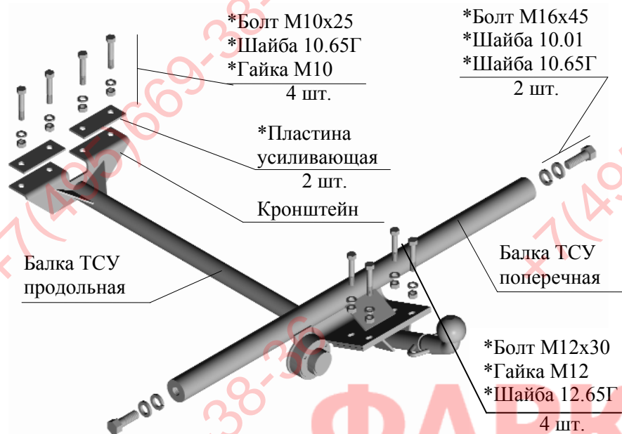
Рис.1 Тягово-сцепное устройство ТСУ 2105.Р

Примечание: детали, помеченные * входят в пакет комплектующих