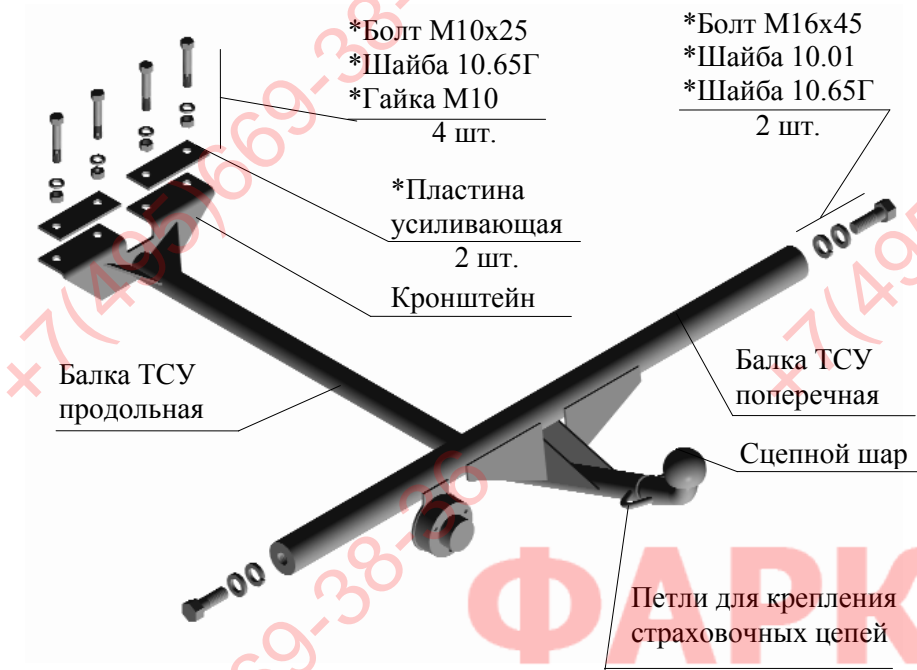
Рис.1 Тягово-сцепное устройство ТСУ 2105

Примечание: детали, помеченные * входят в пакет комплектующих