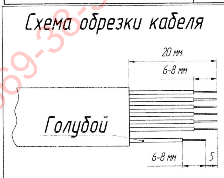
Схема обрезки кабеля