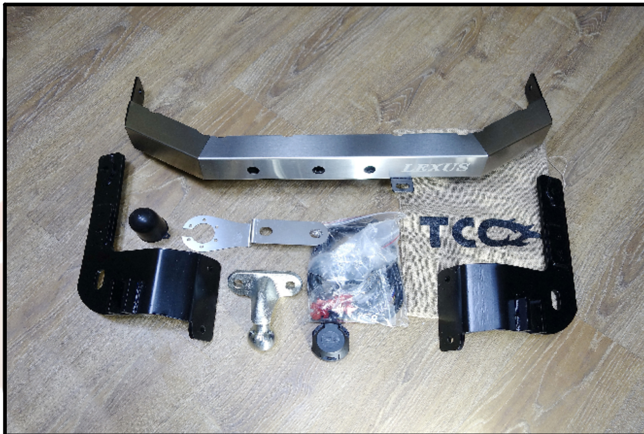
Фаркоп арт. TCU00070