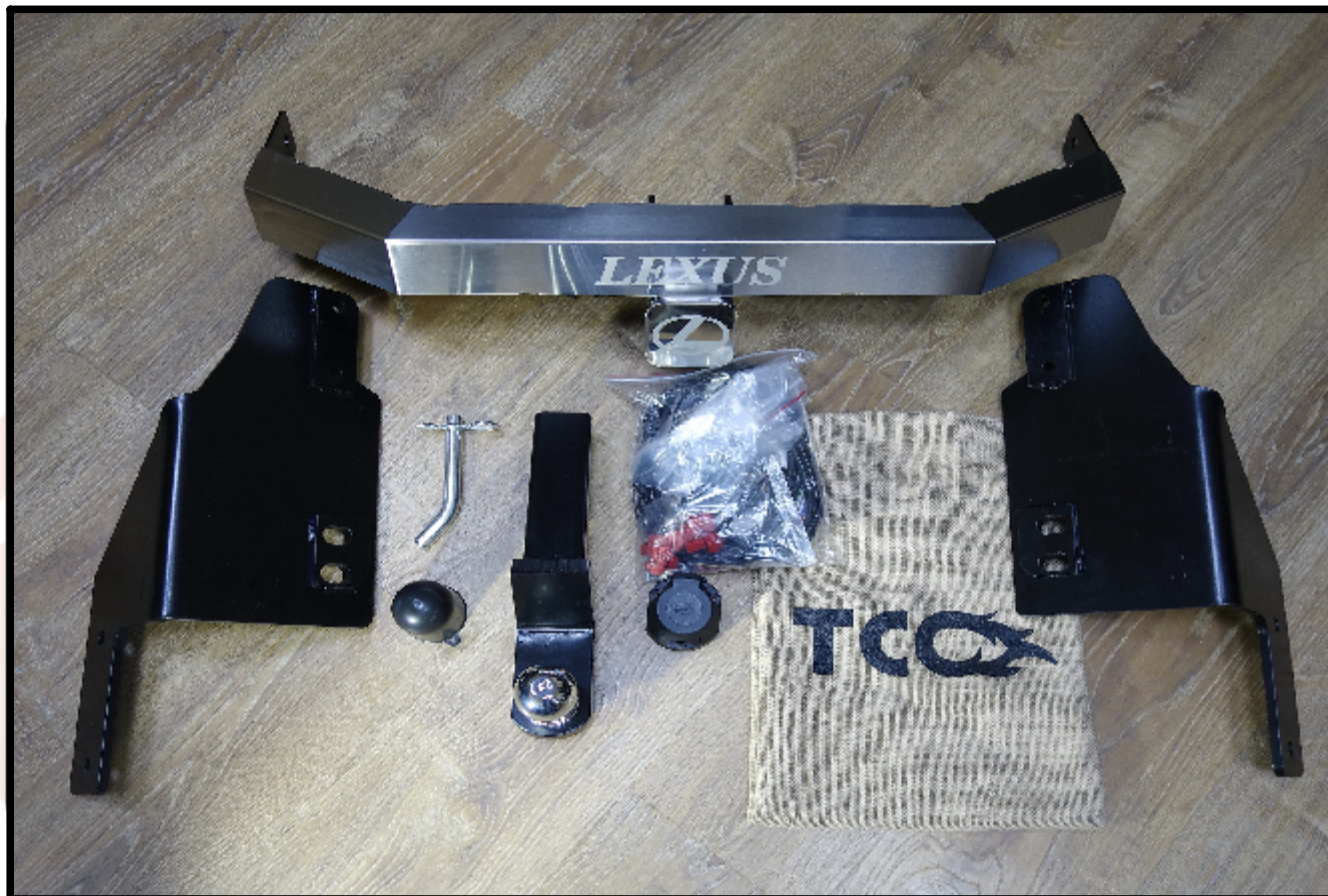
Фаркоп арт. TCU00084