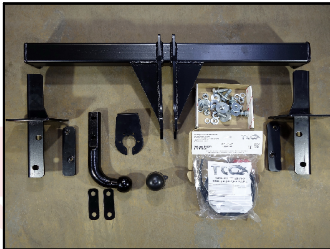
Фаркоп шар тип А арт. TCU00086