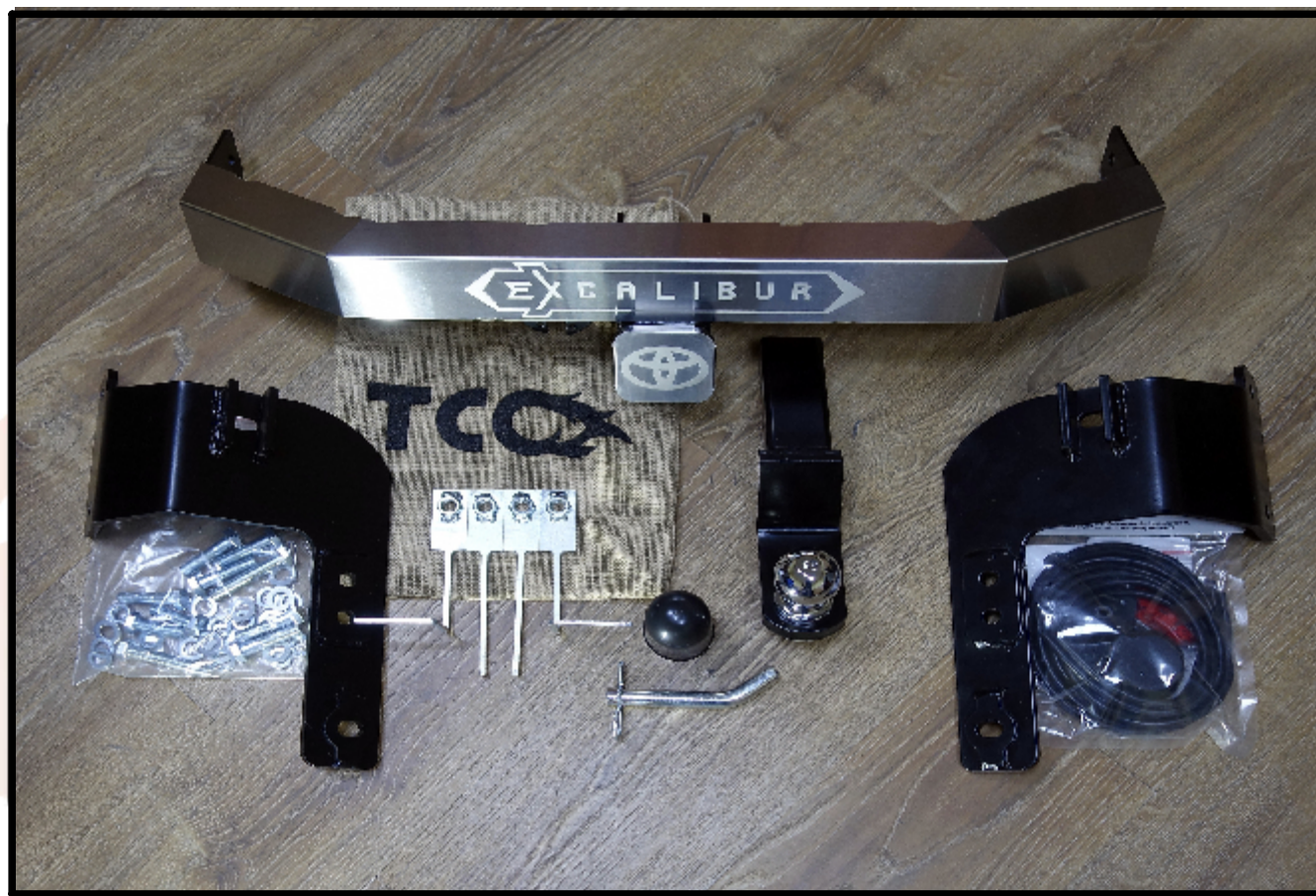
Фаркоп арт. TCU00095